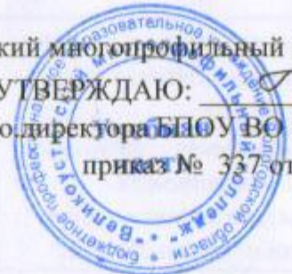
ГРАФИК ЭКЗАМЕНОВ 1 семестр 2022-2023 учебного года