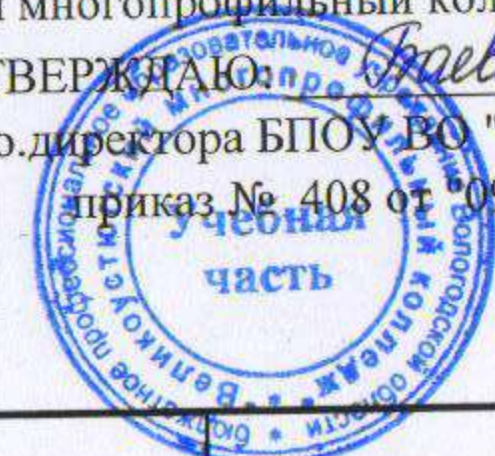
ГРАФИК ЭКЗАМЕНОВ 1 семестр 2023-2024 учебного года